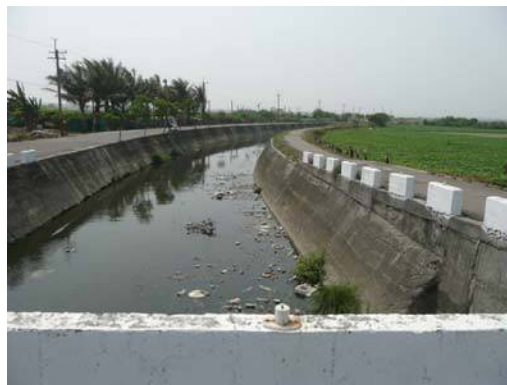
圖說：由東側往西拍攝之大寮線排水