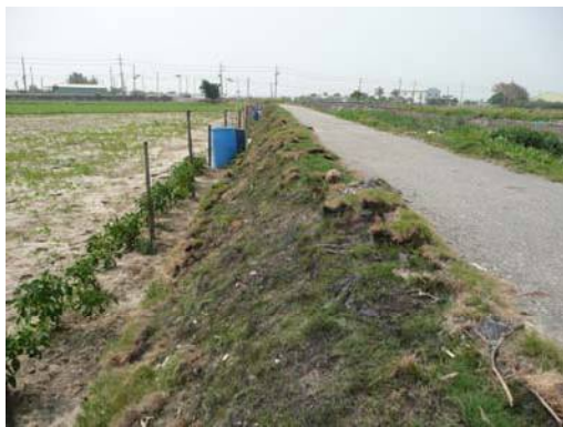
圖說：田埂邊坡可見零星細碎的陶片